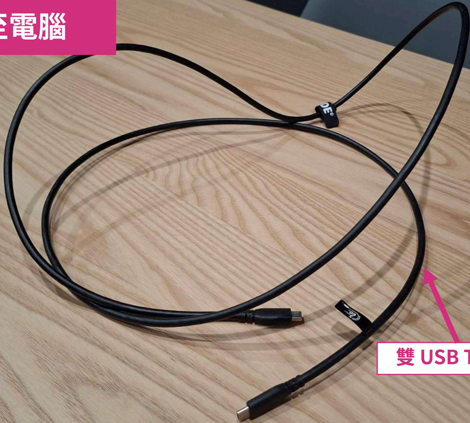
雙 USB Type-C 線